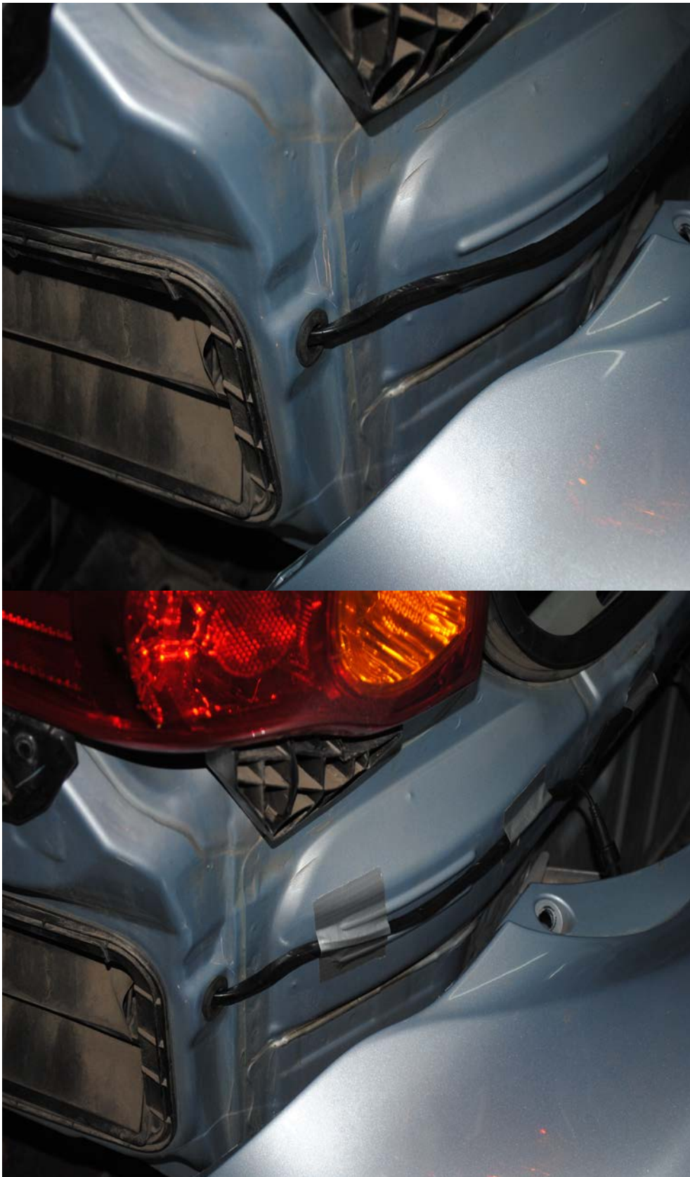
После чего бампер был поставлен на место.