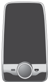
Parrot MINIKIT Slim