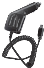
- Зарядное устройство от прикуривателя