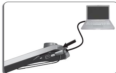
- Зарядите Parrot MINIKIT Slim / Chic