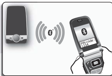
- Связывание с вашим телефоном

Внимание: Функции, описанные в настоящем руководстве, доступны только, если список контактов составлен латинскими символами. Кроме того, необходимо соблюдать произношение и интонацию языка Parrot MINIKIT Slim / Chic (по умолчанию – английский).